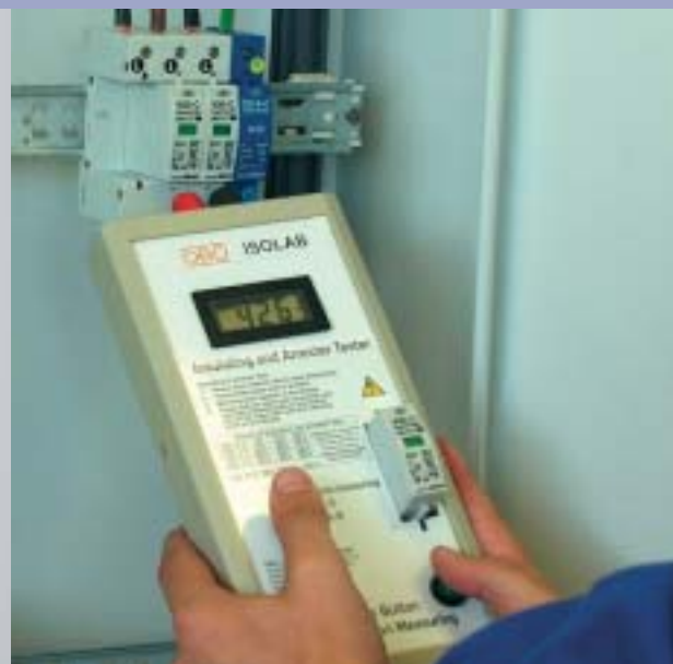
Измерение разрядников защиты от перенапряжения