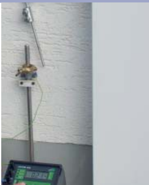
Измерение сопротивления заземления