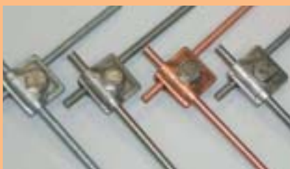
Материалы: Пример Круглый провод 8мм и соединитель быстрого монтажа Vario тип 249 из стали (FT), стали (VA), меди и алюминия

В сфере внешней молниезащиты используются преимущественно следующие материалы: оцинкованная сталь, нержавеющая сталь (VA), медь, алюминий.